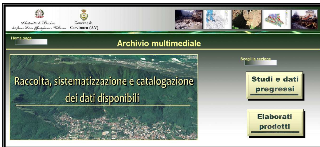
Schermata di interfaccia iniziale con l'Archivio multimediale

Si inserisce inoltre in Allegato 3 alla presente relazione, uno schema esemplificativo della struttura del database, per l'area "Studi e dati pregressi", con indicazione delle sezioni realizzate in Microsoft Access, e dei rispettivi elaborati.